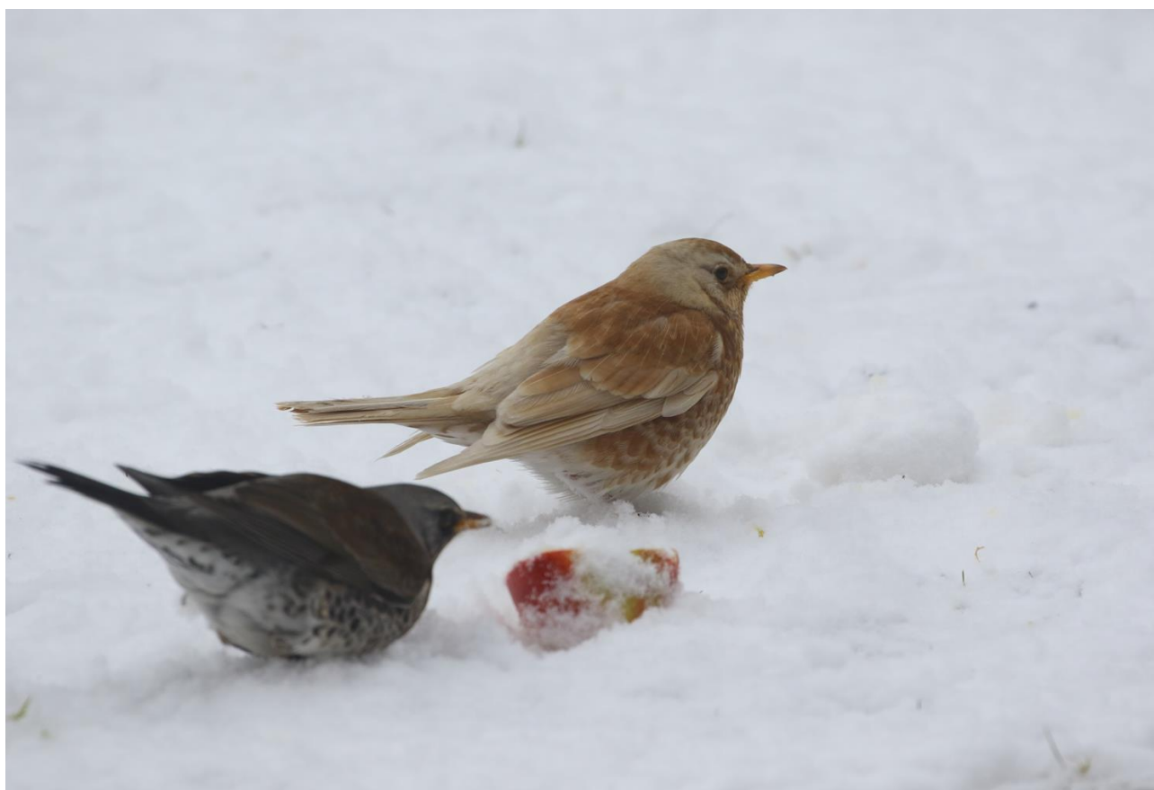
Figur 1 Sjaggere på foderplads i haven.

Allan Nielsen kom ind på en flot andenplads med 66 arter. Vilhelm Dalgaard kom ind på en tredjeplads med 56 arter.